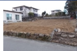
三重県津市(土地) 譲渡額約270万円