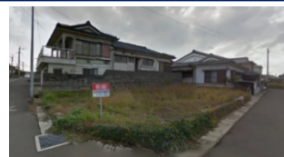
鹿児島県いちき串木野市(土地) 譲渡額約350万円