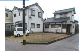
新潟県燕市(土地) 譲渡額約350万円