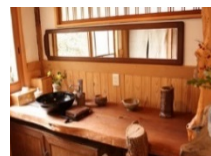
起業等の場として提供