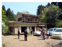
移住者に売却・賃貸